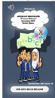
Gambar 1. Halaman Awal Judul