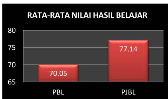
Gambar 1. Rata-rata Nilai Hasil Belajar berdasarkan Model Pembelajaran

Berdasarkan hasil perhitungan yang telah didapatkan dalam penelitian ini, yaitu dari nilai post-test setelah diterapkan model problem based learning dan model project based learning ternyata didapatkan hasil akhir bahwa nilai rata-rata hasil belajar siswa lebih tinggi di kelas model project based learning dibandingkan rata-rata nilai dikelas model problem based learning , yaitu dapat dilihat pada Gambar 1.