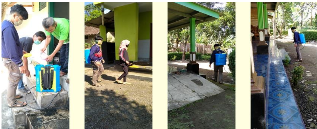
Gambar 5. Kegiatan Penyemprotan Disinfektan

Salah satu cara penanggulangan Covid-19 dengan cara penyemprotan disinfektan. Gerakan ini memiliki manfaat besar guna menimbulkan kesadaran bagi anak, orang tua serta masyarakat sekitar dalam pencegahan perluasan perkembangan organisme berbahaya, baik virus, bakteri, maupun jamur yang dapat menyebabkan penularan penyakit lainnya (Esser et al., 2020). Penyemprotan dilakukan di tempat umum seperti masjid, musala dan rumah warga. Penyemprotan dilakukan seminggu sekali yaitu setiap Jumat pagi. Dokumentasi kegiatan penyemprotan disinfektan seperti yang terlihat pada Gambar 5.