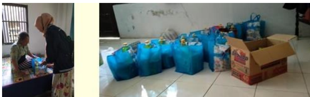
Gambar 4. Kegiatan Pembagian Sembako Kepada Warga Prioritas

Pendampingan pembagian sembako di Desa Prangko'an yang kurang mampu atau tidak mempunyai penghasilan tetap karena dampak Covid-19. Tim Pengabdian Kepada Masyarakat membagikan dari rumah ke rumah warga yang akan dibantu, dalam kegiatan ini Tim Pengabdian didampingi pengurus Desa Prangko'an dan Pemuda Desa Prangko'an. Dokumentasi kegiatan pembagian sembako seperti yang terlihat pada Gambar 4.