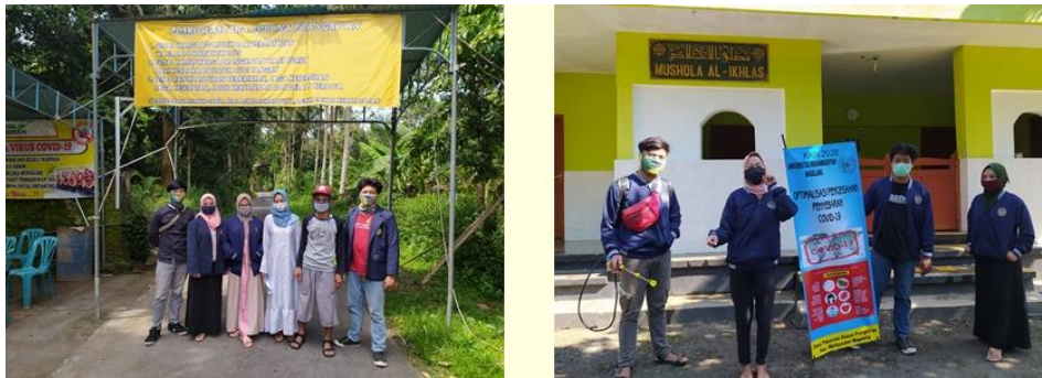
Gambar 2. Alat Peraga Desa Tanggap Covid-19 Desa Prangko'an