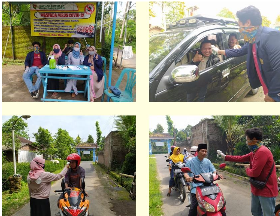
Gambar 3. Kegiatan Penjagaan Posko Desa Tanggap Covid-19