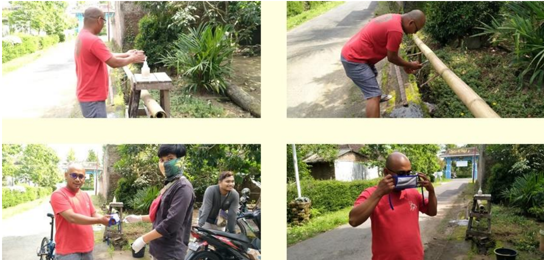
Gambar 6. Kegiatan Pembagian Masker Kepada Masyarakat Desa Prangko'an