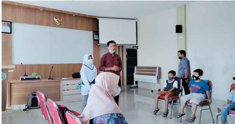
Gambar 4 Tutor Mahasiswa Membantu Peserta Didik Belajar Mandiri

Pengajaran Kampung Inggris dilakukan dengan mengaplikasikan pengajaran eksplisit dan bimbingan intensif (Gambar 4). Peserta didik diberi instruksi yang sederhana dan eksplisit dan bimbingan yang intensif baik oleh tutor dosen dan tutor mahasiswa pada saat belajar. Tujuannya adalah agar peserta didik berhasil dan aktif berusaha berkomunikasi dalam Bahasa Inggris secara mandiri. Hasilnya, peserta didik berusaha aktif secara mandiri ketika diminta untuk ke depan ruangan dan berbicara dalam bahasa Inggris. Pada akhir pertemuan, peserta didik juga memberi saran dan kritikan agar pembelajaran dapat menjadi lebih baik dan menyenangkan bagi para peserta didik.