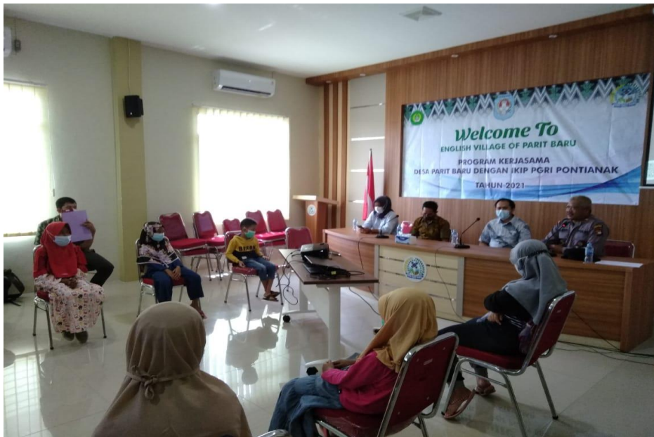
Gambar 1 Pembukaan Kegiatan Kampung Inggris

Implementasi program PkM kampung Inggris Parit Baru ini merupakan keberlanjutan program tahun 2020 sebelum pandemi Covid-19 melalui program kemitraan dengan IKIP PGRI Pontianak. Kampung Inggris Parit Baru Tahun 2021 dilaksanakan dengan diawali kegiatan pembukaan yang dilangsungkan pada 6 Maret 2021 (Gambar 1).