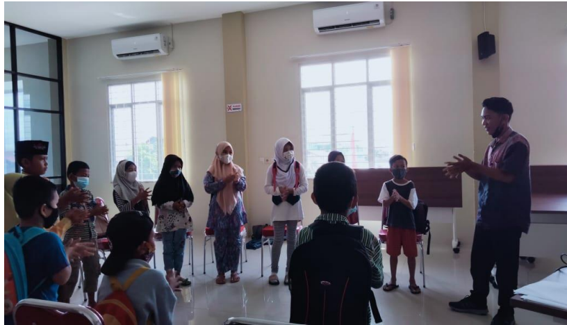
Gambar 2 Tutor Mahasiswa Memulai Kegiatan Pembelajaran

Sesi pertama program PkM (6 Maret 2021) dilaksanakan dengan materi yang diajarkan pertama kali adalah memperkenalkan diri dalam Bahasa Inggris yang dilanjutkan dengan materi mengenai protokol kesehatan (Gambar 2). Peserta didik belajar kosakata dan kalimat sederhana yang terkait protokol kesehatan. Pengajaran terkait materi utama dilakukan menggunakan pendekatan berbasis genre. Agar pembelajaran maksimal, pengajaran dilakukan dengan menyiapkan lembar kerja sederhana yang membantu peserta didik belajar dengan konsep less material more practices . Agar tidak membosankan, penyampaian materi juga dilakukan menggunakan aktivitas permainan kata dan menyanyikan lagu.