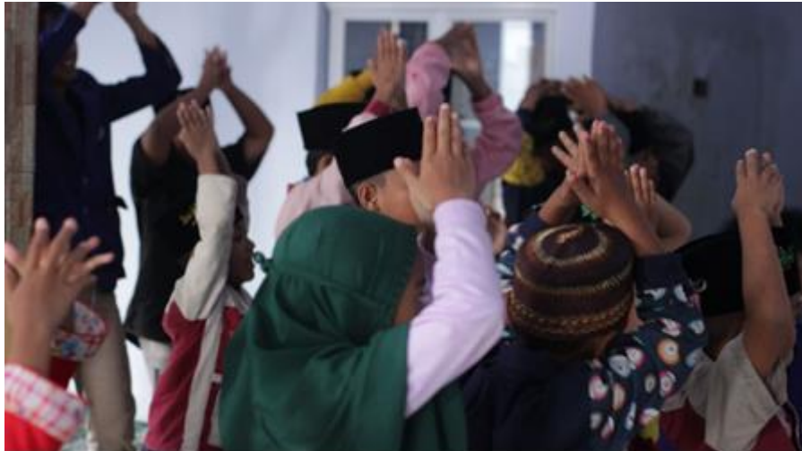
Gambar 3 Kegiatan Bernyanyi Sambil Memperagakan Penyelamatan Diri Saat Erupsi Gunung Meletus