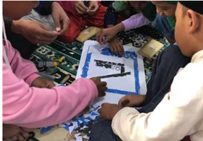
Gambar 4 Kegiatan Pembelajaran Mosaik

memberikan waktu selama 20 menit. Setelah selesai menyusun mosaik, Tim pengabdian meminta satu anak perwakilan setiap kelompok untuk maju dan menjelaskan kepada teman-teman yang lain makna rambu-rambu yang telah disusun. Hal ini bertujuan agar anak-anak lebih mengetahui dan hafal fungsi dari rambu-rambu di kawasan bencana gunung meletus.