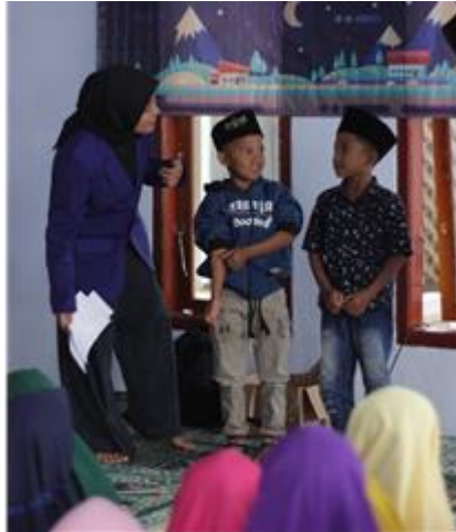
Gambar 2 Kegiatan Sesi Tanya Jawab Terkait Materi yang Terdapat Dalam Video yang Telah Ditayangkan

kebutuhan yang diperlukan saat kondisi tanggap darurat untuk melindungi dan mengamankan diri sendiri maupun orang lain.