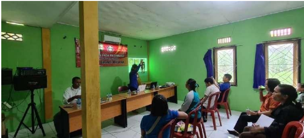
Gambar 2 Pemaparan Produk oleh Narasumber

peran serta kaum perempuan khususnya yang dapat turut ambil bagian dalam kegiatan pariwisata ini tentu semakin melengkapi dukungan dalam kegiatan pariwisata (Hapsari, 2022). Hal ini penting didukung, untuk keberlanjutan dan perkembangan desa wisata.