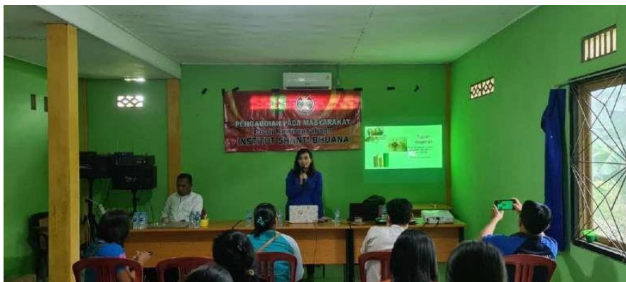
Gambar 1 Pemaparan Perihal Kegiatan Pengabdian

Bambu yang banyak terdapat di desa Sebente ini dapat diolah menjadi berbagai barang setelah diproses. Sebelum dilakukan praktik terlebih dulu pada kegiatan pendampingan, pengabdian memberikan pemahaman mengenai peluang usaha ketika bambu sudah menjadi produk (Gambar 1). Pentingnya pengetahuan akan pemahaman orientasi pasar dan orientasi pembelajaran merupakan hal yang sangat dasar namun menjadi cara strategis suatu UMKM untuk dapat menciptakan produk yang diinginkan oleh konsumen dan meningkatkan inovasi produk yang mereka hasilkan (Anthoni et al., 2021). Pendampingan ini melanjutkan pengabdian yang telah dilakukan sebelumnya mengenai pemanfaatan plastik bekas, sehingga dapat diolah menjadi barang yang bermanfaat dan bernilai jual.