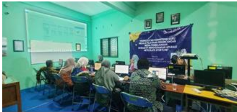
Gambar 2 Pemberian Materi Tentang Articulate Storyline 3