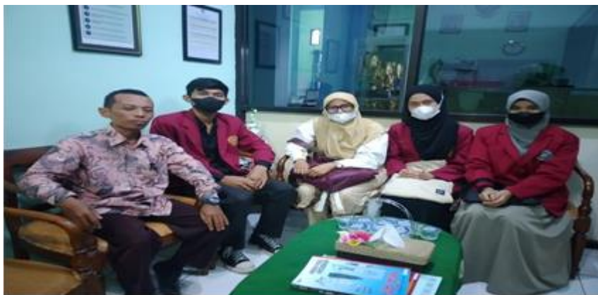
Gambar 1 Kegiatan Focus Group Discussion

Tahapan dalam kegiatan pengabdian ini yaitu kegiatan Focus Group Discussion (FGD) yang dilakukan oleh tim pengabdian bersama dengan mahasiswa PMM dan juga pihak sekolah. Dalam kegiatan FGD yang dilakukan tim dan kepala sekolah membahas tentang teknis kegiatan yang meliputi waktu pelaksanaan, jumlah peserta, ruangan dan materi. Kegiatan FGD seperti yang terlihat pada Gambar 2.