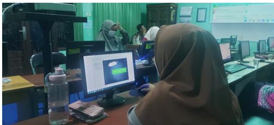
Gambar 3 Pelatihan Articulate Storyline 3

Tahapan selanjutnya setelah kegiatan pelatihan adalah pendampingan dan evaluasi. Untuk kegiatan pendampingan dan evaluasi masih berjalan. Tim pengabdian UMM dibantu dengan mahasiswa PMM melakukan kegiatan pendampingan pembuatan media pembelajaran Articulate Strotyline 3 . Kegiatan pelatihan Articulate Storyline 3 yang dilakukan oleh guru-guru di MA Muhammadiyah 1 Malang seperti yang terlihat pada Gambar 3.