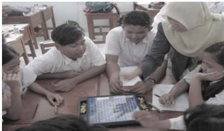
Gambar 2 Siswa Berlatih Membuat Kata dan Kalimat.