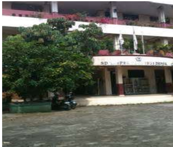
Gambar 1 SMA Tugu Ibu Depok

Secara umum dapat dilihat bahwa dalam lingkungan sekolah siswa atau masyarakat kurang memiliki dorongan untuk maju dalam pengembangan pembelajaran bahasa Indonesia, sehingga siswa yang masuk sekolah tersebut memiliki pencapaian belajar yang rendah. Materi yang akan disampaikan pada sesi 1 sampai 7 adalah teks eksposisi dan prosedur. Siswa yang akan ikut dalam program pengabdian adalah siswa kelas X. Kelas X-7 (berjumlah 34) menjadi kelas kontrol, sedangkan kelas X-2 (berjumlah 32) menjadi kelas eksperimen. Lokasi sekolah tidak jauh dan dapat dijangkau dengan naik motor.