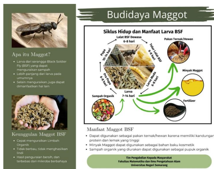
Gambar 3 Leaflet yang digunakan sebagai media sosialisasi

Tahapan selanjutnya adalah persiapan alat dan bahan. Alat dan bahan harus disesuaikan dengan kondisi peserta. Alat dan bahan yang digunakan meliputi kotak plastik untuk wadah sampah organik dan larva BSF, larva BSF yang mewakili kelompok umur, sampah organik dan leaflet. Kotak plastik yang digunakan sudah dilubangi untuk sirkulasi udara (Gambar 2). Larva BSF yang mewakili setiap kelompok umur berguna untuk mendeskripsikan kepada peserta bentuk larva pada setiap fase. Adapun kelompok umur yang digunakan dalam kegiatan ini adalah larva muda berumur 6-8 hari, larva berumur 7-14 hari dan larva pra-pupa. Leaflet digunakan sebagai media sosialisasi untuk memudahkan peserta dalam memahami larva BSF. Leaflet berisi informasi terkait siklus hidup larva BSF hingga manfaatnya disajikan pada Gambar 3.