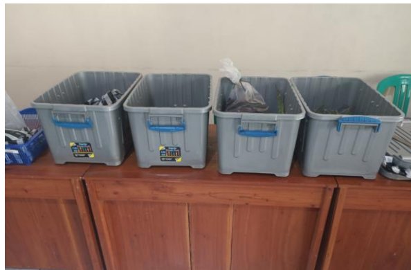
Gambar 2 Kotak plastik yang digunakan sebagai wadah

Tahapan selanjutnya adalah persiapan alat dan bahan. Alat dan bahan harus disesuaikan dengan kondisi peserta. Alat dan bahan yang digunakan meliputi kotak plastik untuk wadah sampah organik dan larva BSF, larva BSF yang mewakili kelompok umur, sampah organik dan leaflet. Kotak plastik yang digunakan sudah dilubangi untuk sirkulasi udara (Gambar 2). Larva BSF yang mewakili setiap kelompok umur berguna untuk mendeskripsikan kepada peserta bentuk larva pada setiap fase. Adapun kelompok umur yang digunakan dalam kegiatan ini adalah larva muda berumur 6-8 hari, larva berumur 7-14 hari dan larva pra-pupa. Leaflet digunakan sebagai media sosialisasi untuk memudahkan peserta dalam memahami larva BSF. Leaflet berisi informasi terkait siklus hidup larva BSF hingga manfaatnya disajikan pada Gambar 3.