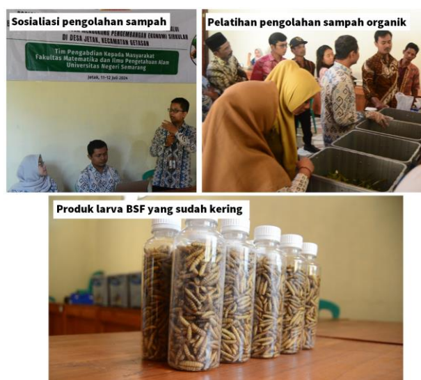
Gambar 4 Kegiatan sosialisasi, pelatihan dan contoh produk larva BSF kering yang bisa dijadikan sebagai pakan ternak

Manfaat ekonomi juga bisa dirasakan secara tak langsung, jika larva BSF digunakan sebagai pupuk kasgot bahkan pakan ternak atau pakan burung peliharaan. Desa Jetak sangat mengandalkan sektor peternakan dimana ayam petelur menjadi jenis ternak yang mendominasi (Heriyanti et al., 2022). Selain memberikan dampak lingkungan, memanfaatkan larva BSF sebagai pakan ternak juga memberikan nutrisi yang sangat baik untuk peningkatan produksi hasil ternak (Amran & Pane, 2020).