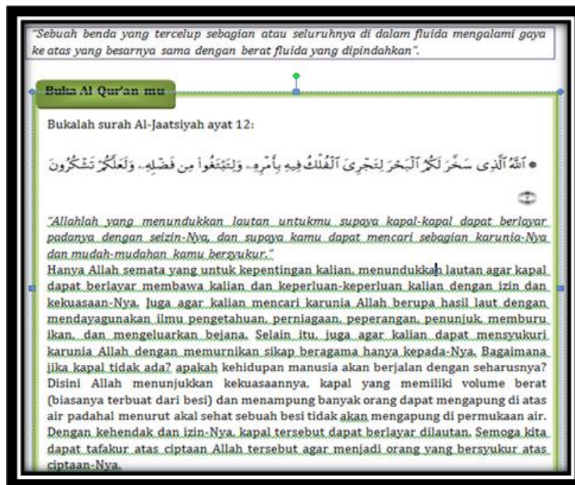
Gambar 2. Materi Yang Dimuati Dengan Ayat Al-Qur'an

Pada modul yang dikembangkan ini, setiap materi yaitu tekanan hidrostatis, hukum Pascal, hukum Archimedes, dan viskositas dimuati dengan ayat-ayat Al-Qur'an yang bertujuan untuk siswa lebih mengenal dan mengetahui keterhubungan fisika dengan Al-Qur'an. Berikut integrasi materi fisika dengan ayat al-Qur'an dapat dilihat pada Tabel 3.