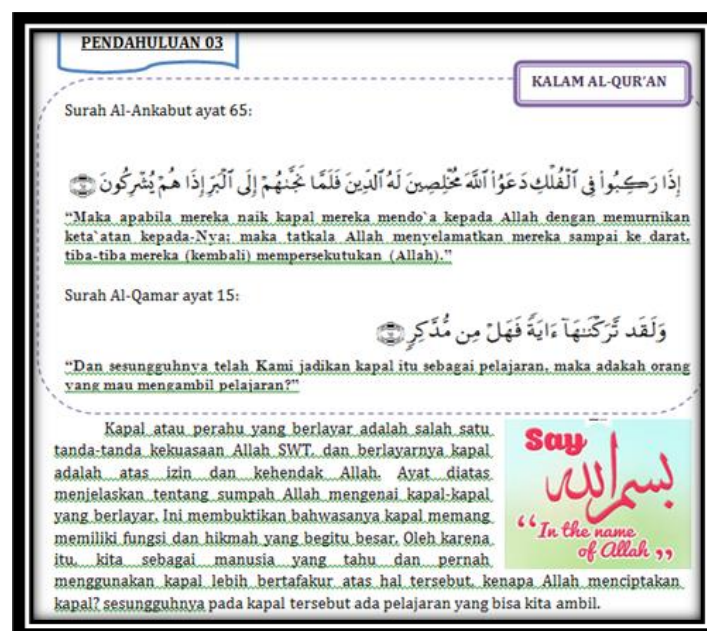
Gambar 1. Pendahuluan Materi Sebagai Motivasi

Modul yang dikembangkan disesuaikan dengan karakteristik siswa dan materi fluida statis. Modul ini berisi materi fluida statis berintegrasi ayat Al-Qur'an. Modul terdiri dari sampul depan, kata pengantar, daftar isi, pendahuluan (meliputi deskripsi, petunjuk penggunaan modul, tujuan akhir, standar kompetensi, kompetensi dasar, dan indikator), peta konsep, kata kunci, kalam Al-Qur'an, uraian materi, kolom Al-Qur'an, buka Al-Qur'an mu, contoh soal, lembar kerja siswa, uji kompetensi, pesan nasihat, rangkuman, daftar pustaka, glosarium, kunci jawaban uji kompetensi, dan tentang penulis sebagai tambahan. Model pembelajaran yang digunakan ialah model pembelajaran generatif. Sintaks model pembelajaran generatif menurut Zainuddin dan Suriasa (2014) terdapat 5 fase yaitu: (1) pengingatan, (2) tantangan dan konfrontasi, (3) reorganisasi kerangka kerja konsep, (4) aplikasi dan pematapan konsep, dan (5) refleksi. Berikut ini adalah produk yang telah dikembangkan dapat dilihat pada Gambar 1 dan Gambar 2.