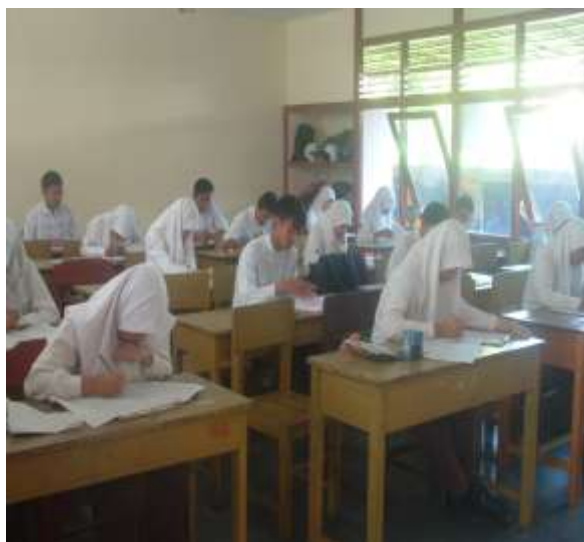
Gambar 1a. Pelaksanaan Tes

Pada langkah pertama ( Analysis ) yaitu untuk memperoleh gambaran lengkap dari apa yang diketahui dan dari apa yang dipermasalahkan, langkah kedua ( Planning ) yaitu untuk mengubah pemasalahan menjadi sebuah masalah atau soal yang penyelesaiannya secara prinsip dapat diketahui, langkah ketiga ( Computation ) yaitu untuk merealisasikan rencana pemecahan yang dituliskan dengan jelas dalam bentuk pengejaan dan hasil, langkah keempat ( Looking back ) untuk memeriksa apakah masalah sudah diselesaikan dengan tuntas, atau memeriksa apakah penyelesaian sudah atau belum layak sebagai jawaban pertanyaan atau penyelesaian masalah.