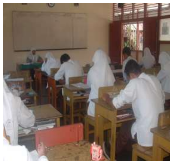
Gambar 1b. Pelaksanaan Treatment

Setelah diberikan pembelajaran menggunakan metode yang berbeda, maka kedua kelas diberikan post-test di akhir pertemuan. Tujuannya adalah ingin melihat sejauh mana efek yang ditimbulkan dari pembelajaran yang telah disampaikan.