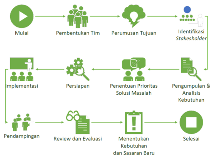
Gambar 1. Alur Metode Pelaksanaan

Mitra dalam hal ini terlibat aktif sebagai peserta dan diharapkan dapat menggunakan aplikasi Mendeley dalam membuat karya tulis ilmiah. Sekaligus dapat mempublikasikan karyanya pada jurnal terakreditasi SINTA. Sedangkan untuk evaluasi kegiatan dilakukan dengan teknik komunikasi tidak langsung yaitu melalui angket. Agar didapatkan respon dan tanggapan terhadap kegiatan yang dilakukan.