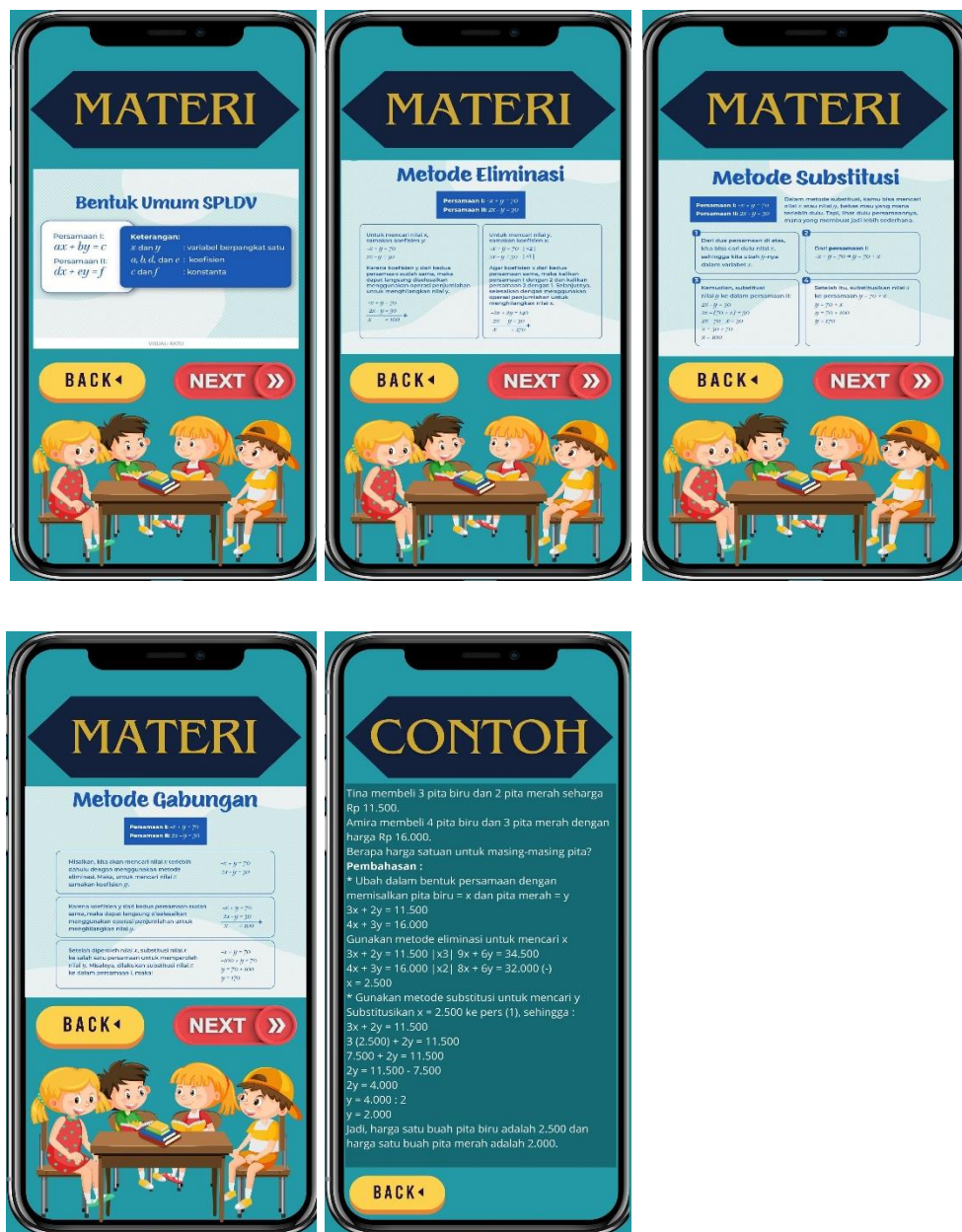
Gambar 4. Tampilan materi