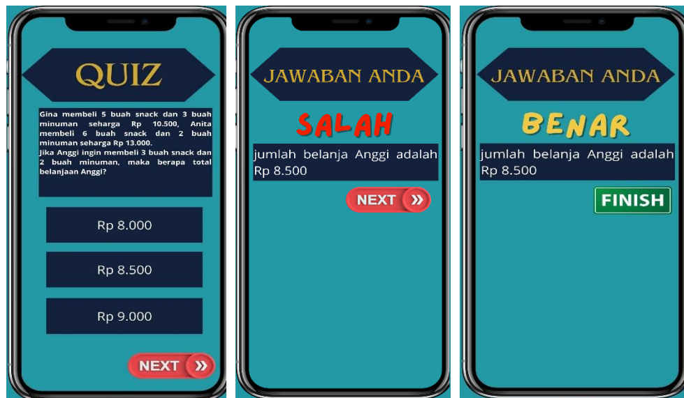
Gambar 5. Tampilan quiz

Berdasarkan penelitian pengembangan media pembelajaran sebelumnya pernah dilakukan oleh Putri dan Swaditya (2018) menyimpulkan, berdasarkan penilaian yang dilakukan oleh ahli dan uji coba ke siswa, maka dapat disimpulkan bahwa media pembelajaran matematika berbasis android pada materi program linear dinyatakan valid dan praktis sehingga dapat memudahkan siswa dalam proses pembelajaran baik di dalam maupun di luar kelas. Kemudian hasil penelitian yang dilakukan oleh Aditya Jantra Madana (2016) yang dihasilkan adalah media pembelajaran berbasis android sangat layak digunakan dan dapat mendukung kegiatan belajar mengajar peserta didik. Kemudian Hasil penelitian yang dilakukan oleh Agustina Wulandari pada (2018) dihasilkan bahwa media pembelajaran berbasis android yang dikembangkan sangat layak digunakan.