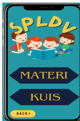
Gambar 3. Main menu

Pada tampilan main menu media pembelajaran berbasis android berisikan judul dan pilihan yaitu materi atau quiz. Dan ada tombol back untuk kembali ke tampilan awal. Tampilan main menu media pembelajaran berbasis android dapat dilihat sebagai berikut.