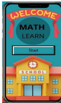
Gambar 2. Tampilan awal